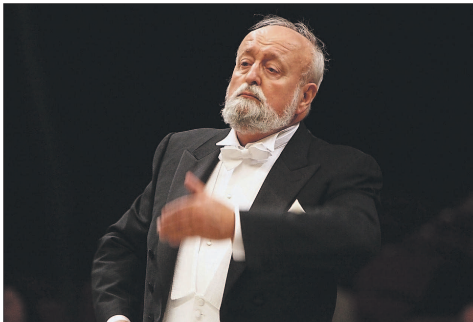
Krzysztof Penderecki

ła miejsce 15 października 1886 roku w Leeds.